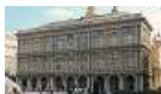
Covid-19, programma... Impostato un modus operandi molto collaborativo tra le tre Regioni sia a livello politico...