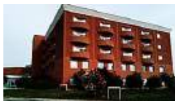
Coronavirus: altri quattro decessi... Nelle ultime 24 ore si sono registrate due perdite nel presidio di Ponente e due in quello di Levante