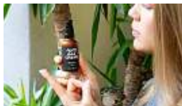
Il rimedio naturale per distendere il... The Secret Pot