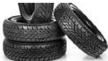
I prezzi degli pneumatici online... Pneumatici | Link Sponsorizzati