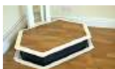
Guarda quanto costano... Stair Lift | Search ads