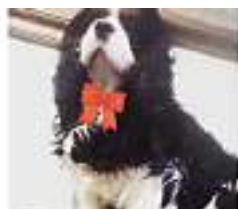
Addio a Blasko, il cagnolino più... Era uno dei protagonisti del progetto di "pet therapy nelle case di riposo" a Cairo, Carcare, Millesimo e Calizzano