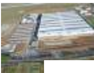
Attualità Piaggio Aerospace, ecco la pubblicazione dell'invito a presentare manifestazioni di interesse sull'azienda