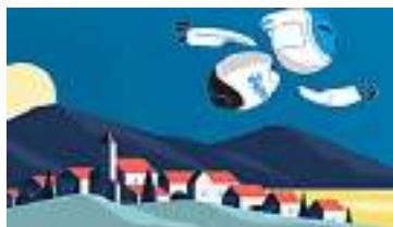
EOLO SUPER da 29,90€/mese con... EOLO