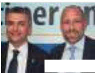
Speciale elezioni Sanremo Sanremo: elezioni, visita del viceministro Rixi al point di Tommasini "Allo studio una mobilità alternativa via mare"