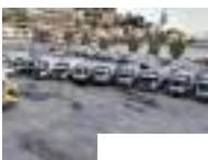
Sanremo Ospedaletti Sanremo: l'assemblea dei soci di Amaie Energia approva il bilancio, rinviata la discussione sulla gestione della ciclabile