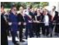
Eventi Bordighera: a Villa Regina Margherita l'inaugurazione della mostra "Claude Monet, ritorno in Riviera" (Foto e Video)